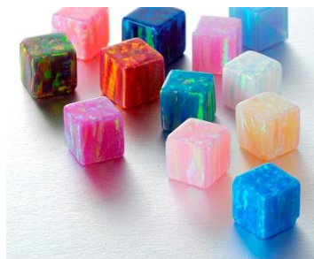
Opal auf Polymerbasis (links) und mit Harz imprägnierter Opal (rechts)