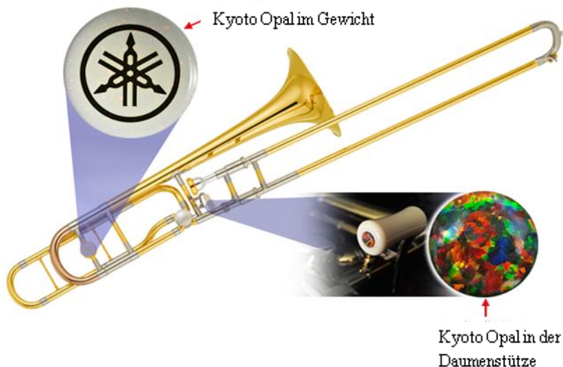
Yamaha-Posaune mit Kyoto Opal

Kyoto / Neuss, 26. April 2016 – Kyocera gibt bekannt, dass die Yamaha Corporation, ein führender Hersteller von Musikinstrumenten, den „Kyoto Opal“ von Kyocera für eine limitierte Auflage von Posaunen verwenden wird. Das synthetische Opal-Material besticht durch eine einzigartige Brillanz. Es kommt beim Gewicht* und der Daumenstütze der Posaune zum Einsatz und verleiht dem Design des Instruments einen luxuriösen Griff, der das Produktkonzept der Sonderedition zum 20-jährigen Jubiläum der Xeno-Serie von Yamaha hervorragend ergänzt. Das neue Modell (YSL-882O20TH) ist in Europa, Nordamerika, Japan und weiteren Ländern im Asien-Pazifik-Raum erhältlich.